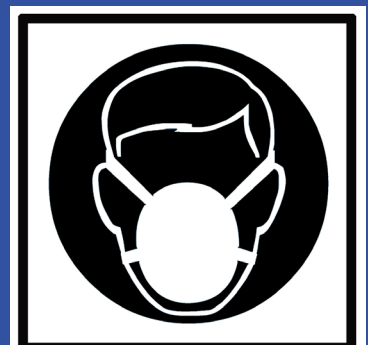
Mund/ Nasenschutz tragen