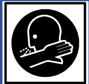
In die Armeuge niesen