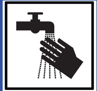
regelmäßig Hände waschen